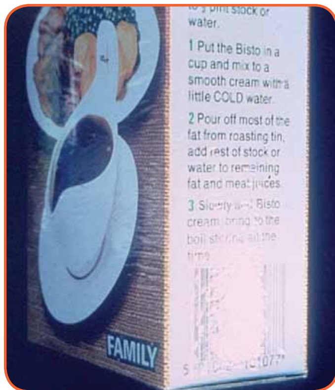
Slika 6: Potpuno izbrisan odštampani bar kod