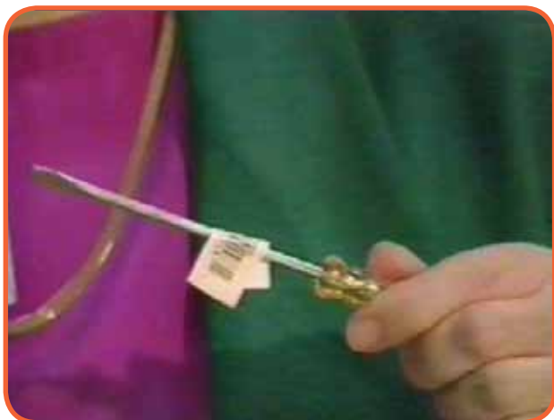
Slika 4: Primjer bar koda kojeg je nemoguće očitati na kasi

napor, koji su za njega nepotrebni. Kad su kratki rokovi proizvodnje i isporuke, odgoda zbog ponovnog pakovanja, ili ponovnog štampanja naljepnica, može ugroziti zadati rok isporuke. Ako proizvode ipak isporučite, pa se naknadno ustanovi neispravnost bar kodova, vaš poslovni partner će morati da vrši ispravke u svojim sistemima podataka, a najvjerovatnije da će biti primoran da vam vrati robu sa pogrešnim bar kodovima. Rješenje ovih problema ponekad može potrajati i po nekoliko sedmica, a krajnji ishod jeste gubitak više budućih potencijalnih isporuka, a posebno je problem nezadovoljstvo poslovnog partnera.