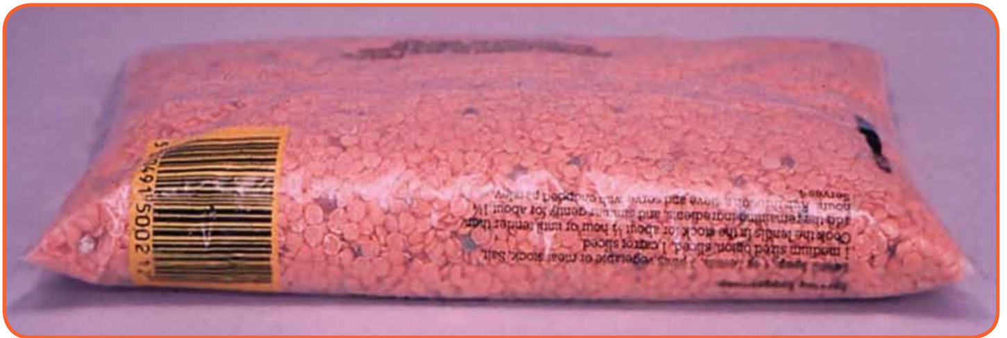
Slika 1: Loše pozicioniran bar kod