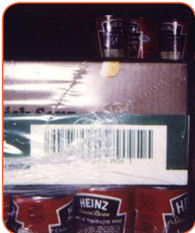
Slika 2: Grupno pakiranje - loša pozicija

Za poslovnog partnera dodatni trošak predstavljaju vrijeme i napor da se riješi problem koji ste vi prouzrokovali kašnjenjem isporuke. Svaki neplanirani dodatni problem, zahtijeva od vašeg poslovnog partnera da potroši dodatno vrijeme i