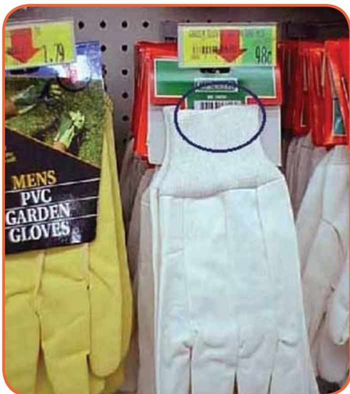
Slika 5: Primjer lošeg bar koda na tekstilnom proizvodu

Potencijalni članovi Udruženja GS1 najčešće ne znaju da će se susresti sa nepredvidivim troškovima koje će imati zbog upotrebe neispravnih, ili nelegalnih GS1 brojeva. U slučajevima kada im je potrebna neka od usluga GS1, oni će je moći dobiti samo ako su dio sistema GS1 i ako koriste ispravne GS1 brojeve. Ove usluge su npr. evidentiranje članica u Globalnom GS1 registru GEPIR, Globalni GS1 katalog GDSN, EPC, Sljedivost i dr. U zavisnosti od veličine preduzeća i od zahtjeva njihovih kupaca, nemogućnost dobivanja usluga GS1, će dovesti korisnika nelegalnih brojeva do potrebe da potraži ispravne GS1 brojeve, koji će biti u skladu sa GS1 sistemom.