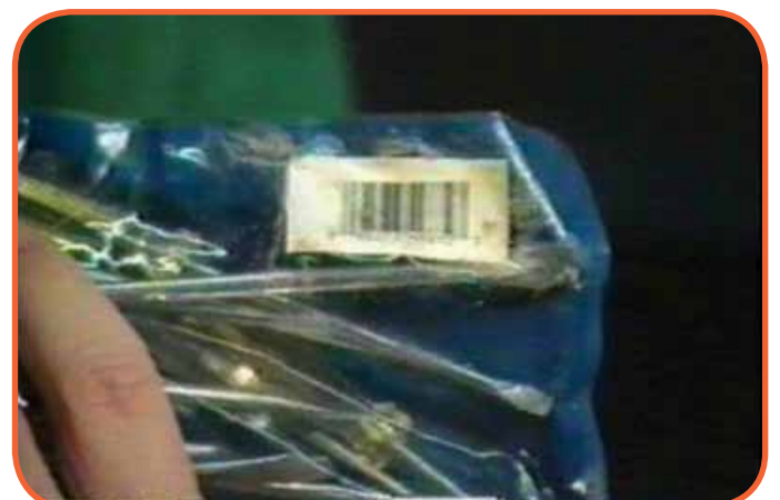
Slika 3: Izbor lošeg materijala na kojem je štampan bar kod