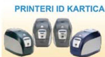
PRINTERI ID KARTICA