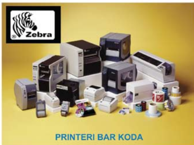
PRINTERI BAR KODA